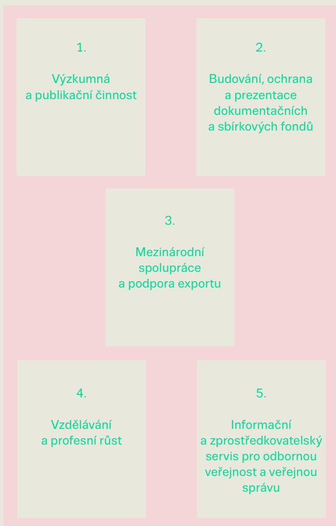
Obrázek 2: Základní pilíře odborné činnosti IDU

Odborná náplň činnosti IDU bude postavena na pěti základních pilířích.