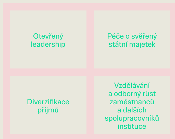
Obrázek 1: Základní principy rozvoje IDU

Hlavní cíle jsou v souladu s principy rozvoje a dalšího růstu IDU.